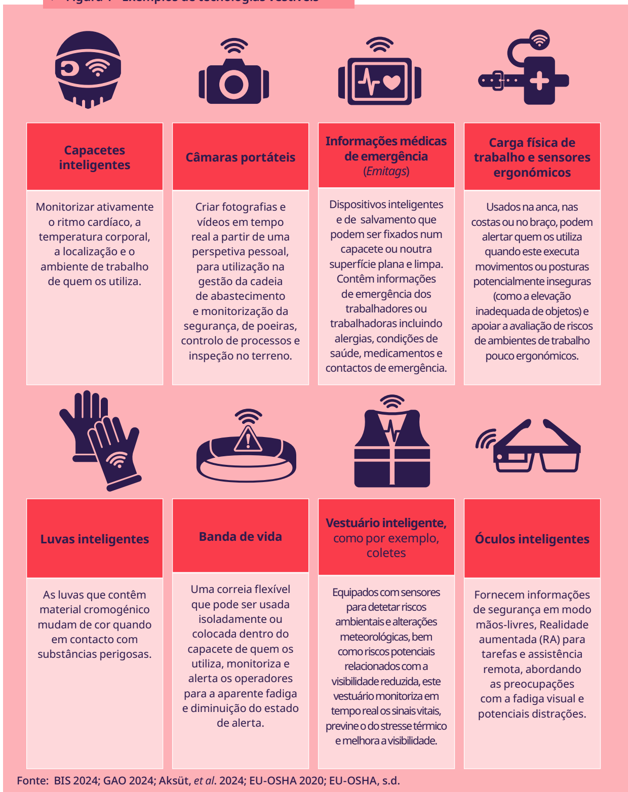
► Figura 1 - Exemplos de tecnologias vestíveis